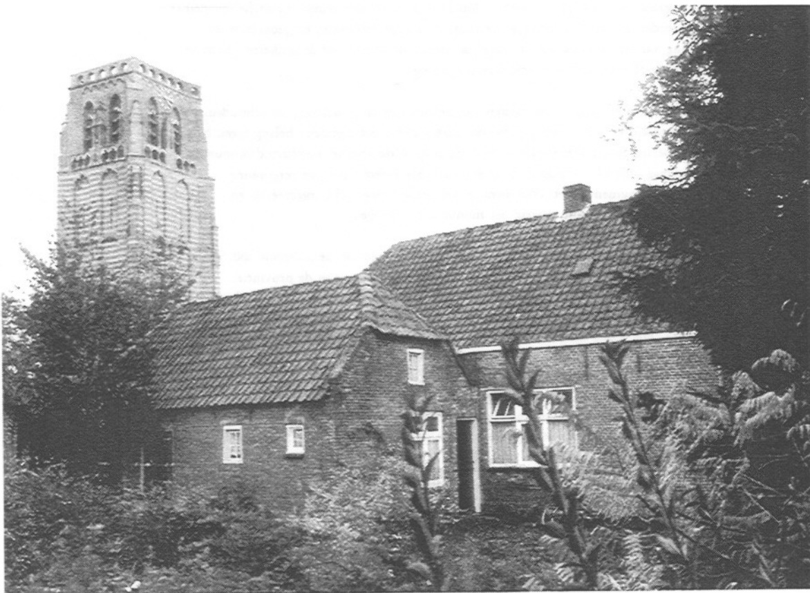
Torenstraat 4 gezien vanaf de tuinkant

Het behoort nu tot de zorg van de gemeente om voor het pand een passende bestemming te zoeken, waarbij de historische waarden en de situering in het dorpscentrum zo optimaal mogelijk tot hun recht komen. De heemkundevereniging wil daar graag over meedenken.