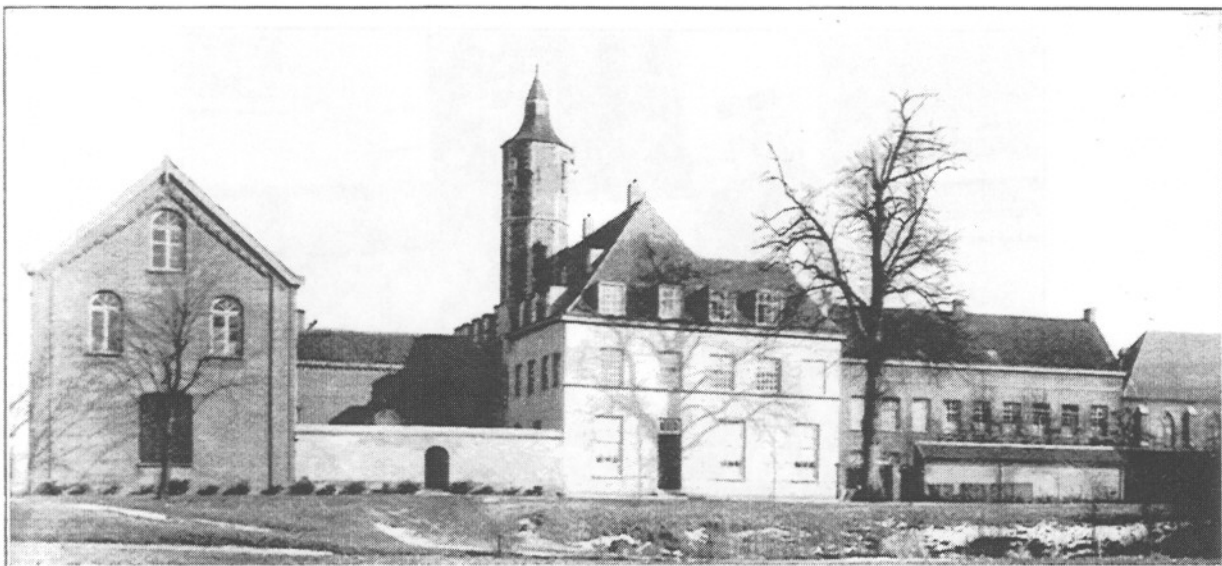
Meisjes-bouw. opgericht in 1868—'69, onder eet- en speelzaal, atelier der handwerken, boven slaapzaal.