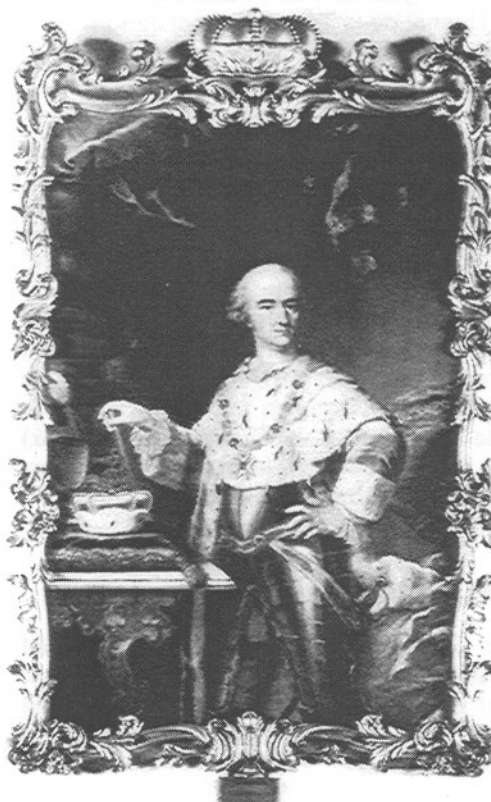
Karel Philip Theodoor van Palts - Sulzbach, markies van Bergen op Zoom, de laatste Heer van Herlaer

Hun zoon, Karel Philip Theodoor van Sulzbach, keurvorst van de Palz , was de laatste heer van Herlaer. In 1755 schenkt hij aan de pastoor van Sint-Michielsgestel een jaarlijkse bijdrage van f.160,- voor het onderhoud van de kapelaan. De rentmeester rapporteert in zijn verslag over 1767 dat het sterrenbos bijna is voltooid. In 1798 wordt de heerlijkheid opgeheven. De bezittingen van de heer gaan over aan de Bataafse Republiek.