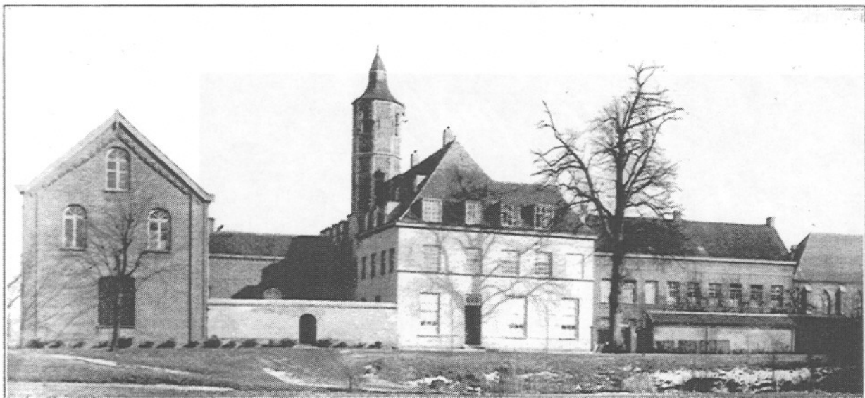
Meisjes-bouw. opgericht in 1868-'69, onder eet- en speelzaal, atelier der handwerken, boven slaapzaal.