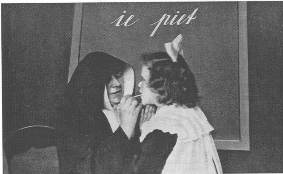
Inoefening van den klank ie, volgens de voormalige methode.

En dan de tweede soort, ja, wat zal ik daarvan zeggen? Een goede grondslag voor een degelijke, flinke opvoeding missen deze verwarden geheel. Wij moeten dan beginnen bij het eerste begin, wat de ontwikkeling dan ook weer tegenhoudt.